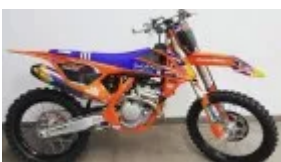
A revisión varios modelos de KTM por un problema en las bielas

KTM ha llamado a revisión a los modelos 250 SX-F y 250 SX-F Factory Edition 2016 para una sustitución del conjunto completo del cigüeñal. El fallo parece estar en un posibles error en el proceso de fabricación de las bielas, que puede acabar provocando un fallo a corto plazo que suponga la rotura de dicho elemento bajo [...]